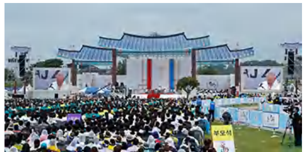
韓国西部のヘミ城で8月17日に行われた AYDの閉会ミサで説教する教皇フランシスコ