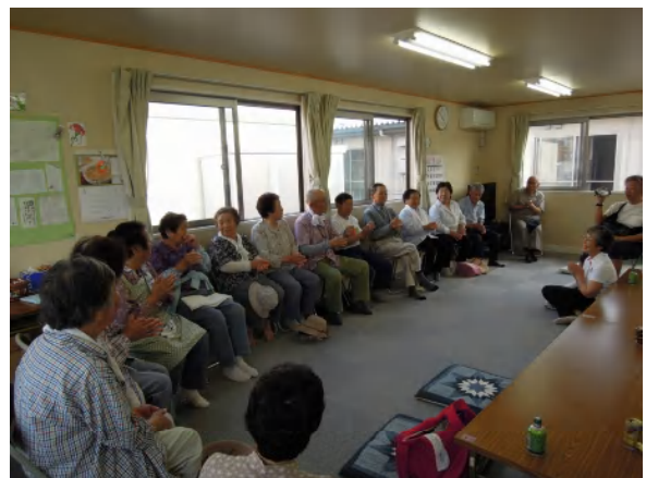
仮設の皆様との懇談風景

仮設住宅の皆様とお別れする時にはいつも「お元気でね。」しか言えなくて…。私たちは自分の家に帰るのに、自分たちの家に帰れない方々が見送ってくださることに申し訳ない気分を味わいます。国は本当にこの方たちの生活再建を考えているのだろうか、利権がらみの様々な思惑に、弱い立場の被災者が弄ばれているのではないかと大きな疑問を感じます。被災された方々が、自分たちは忘れられていくのではないかと不安を少しでも和らげ繋