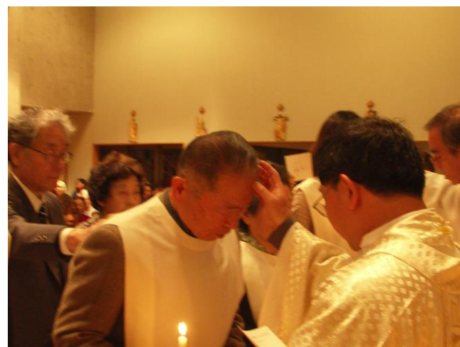
「洗礼の泉から生まれる人々をあなたの子どもとしてください」