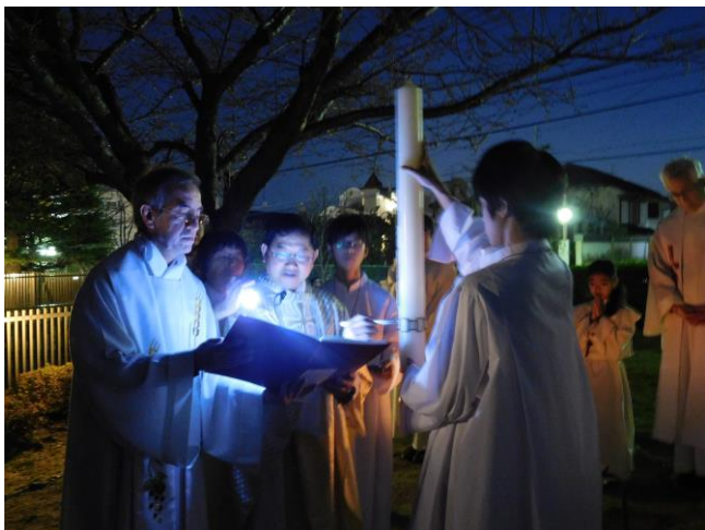
「清い心で永遠の光を受けることができますように」