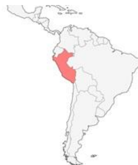
南米大陸に位置するペルー共和国(赤い部分)